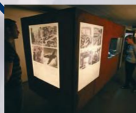
Bunker: esposizione sulla distruzione e ricostruzione della Fuggerei. Ingresso attraverso l'area verde.