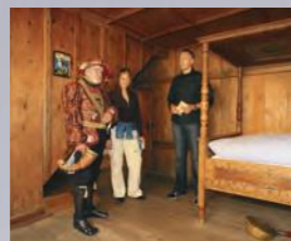
Museo della Fuggerei, Mittlere Gasse N° 13 e 14