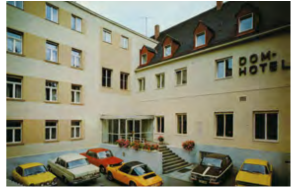
1972 wurde die ehemalige „Goldene Glocke am Dom“ in „Dom Hotel“ umbenannt.