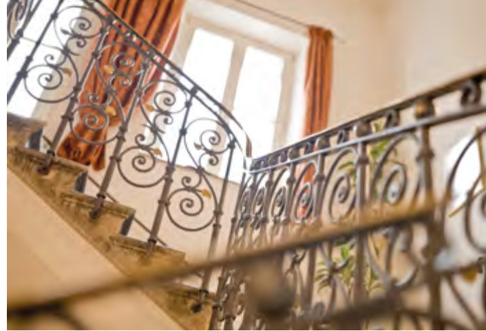
Blick ins Treppenhaus

In den Jahren von 2011 und 2013 hat das Dom Hotel in die Verschönerung, Erweiterung und die energetische Modernisierung des Hauses investiert. Die Außenfassade am Wohntrakt des Baukomplexes (an der Frauentorstraße) wurde saniert. Dekorative Fassadenelemente wie die Hausmadonna und die Löwenköpfe unter dem Dachvorsprung kommen nun noch besser zur Geltung.