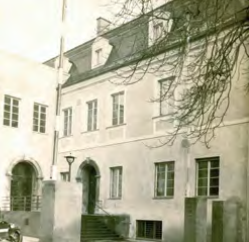
Links: Der Eingangsbereich der Gaststätte „Goldene Glocke“ im Jahr 1932.