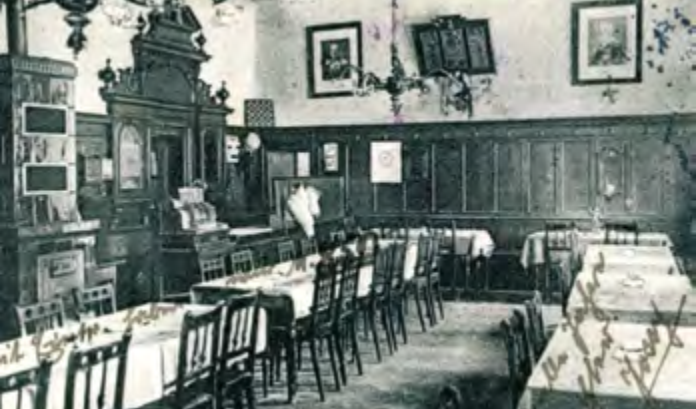
Oben: Der Blick in die holzgetäfelte Gaststube der „Goldenen Glocke“.; Rechts: Tischreihen im Festsaal