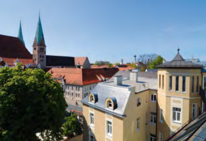
Oben: 2008 wurde der Turm mit Turmzimmer errichtet; Rechts: Brunnenfigur im Innenhof