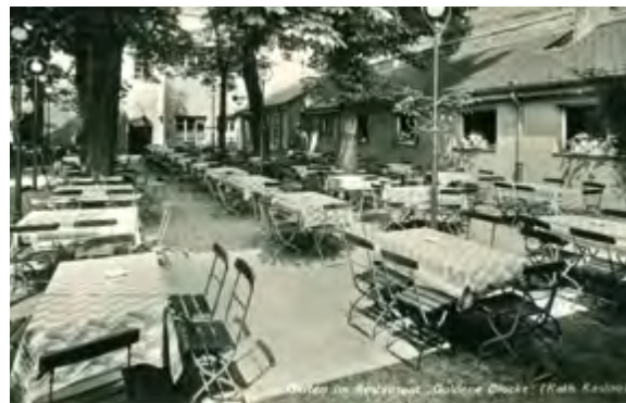
Rechts: Biergarten der „Goldenen Glocke“.