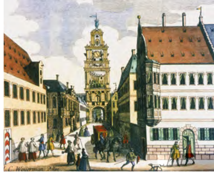
Am Frauentor beim Dom wurde 1508 die Dompropstei errichtet.

Wer war der Dompropst, der an so herausragender Lage über ein derart großes Anwesen verfügte, dass dort sogar ein Kaiser nächtigte? Der jeweilige Dompropst war nicht nur Vorsitzender des Domkapitels, er verwaltete auch dessen Vermögen, war für die