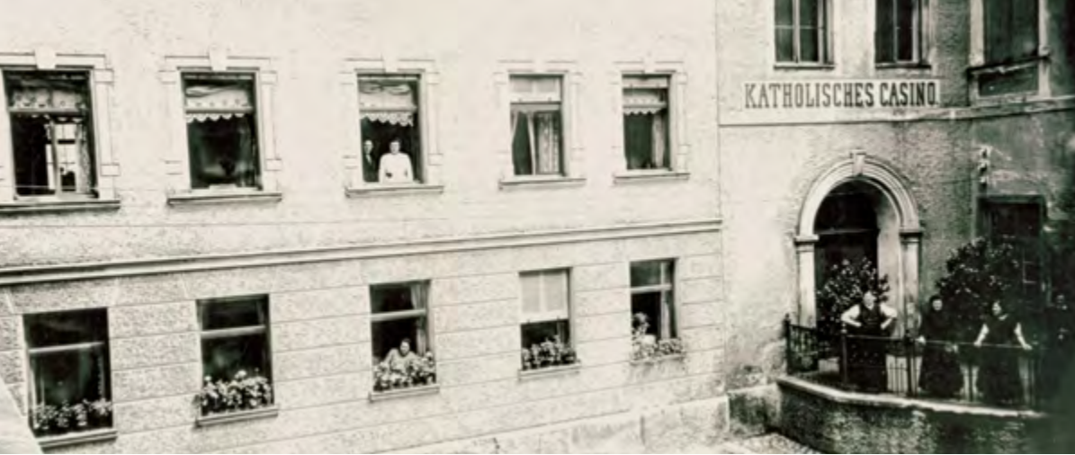
Blick auf das „Katholische Casino“.