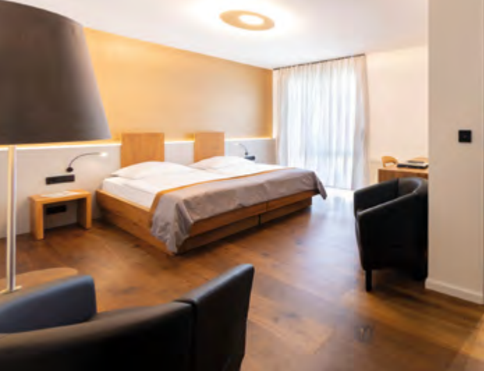
Neu gestaltetes Standard Select-Zimmer

50 In den Jahren 2019 und 2020 wurden die Maisonetten und die darunter liegenden Zimmer komplett erneuert und mit energieeffizienten Kühldecken ausgestattet, digitale Schließanlagen und Schallschutzfenster gehören ebenfalls zum neuen Standard des Dom Hotels. Auch die Aufzuganlagen sind auf den neuesten Stand gebracht.