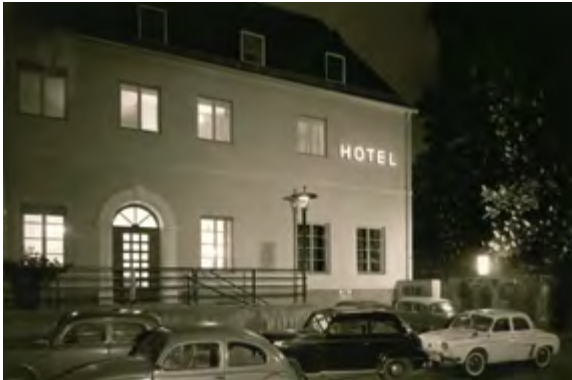
In den 1950ern – die nach der Zerstörung wiederaufgebaute „Goldene Glocke“.

zum Bau von Messerschmitt-Jagdflugzeugen vom Typ Me 109 bestimmt waren.